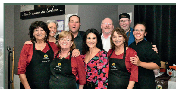
Le repas gastronomique préparé par Bistro Henri de l'Auberge La Rosepierre a été succulent à la hauteur de leur réputation.

Merci de votre implication et à l'an prochain!